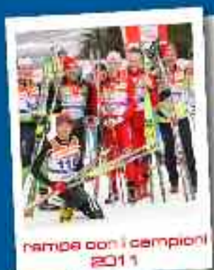
rampa con i campioni 2011

FINALE Tour de Ski Salto Femminile Salto Maschile tour de gusto fiemme arena south nordic festival Combinata Nordica